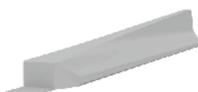
Elemento terminal RB80_7T (pendiente 1:12)