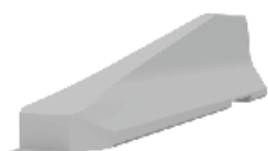
Elemento terminal RB80_4T (pendiente 1:5)